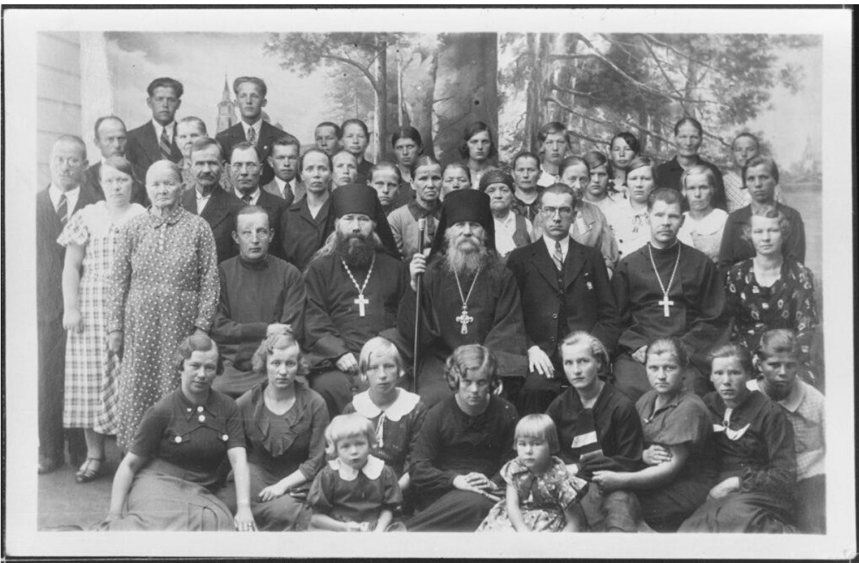
Suistamon seurakuntalaisia retkellä Valamossa 1936, kuva Museovirasto