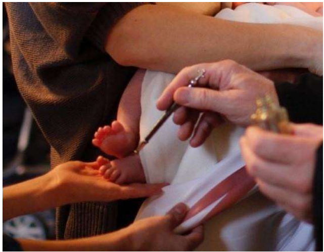
Mirhavoitelu, kuva Eija Honkaselkä