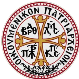
Konstantinopolin Ekumeenisen patriarkan sinetti

Konstantinopolin pyhä synodi antoi Tomos-asiakirjan 6. heinäkuuta 1923. Tomos-asiakirja on Suomen ortodoksinen kirkon kanoninen peruskirja. Siinä Suomen ortodoksinen kirkko otetaan autonomisena kirkkona osaksi Konstantinopolin patriarkaattia.