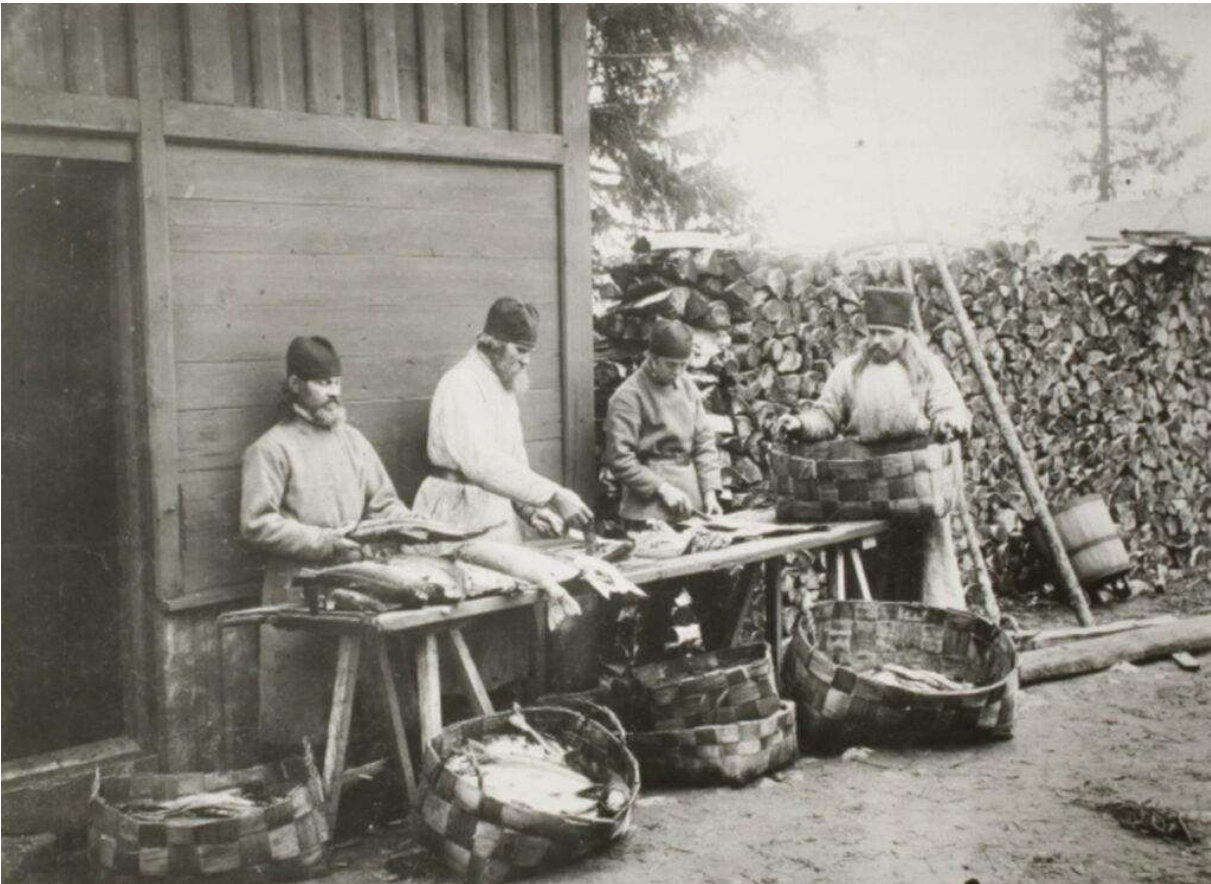
Valamon munkit lohenperkuussa