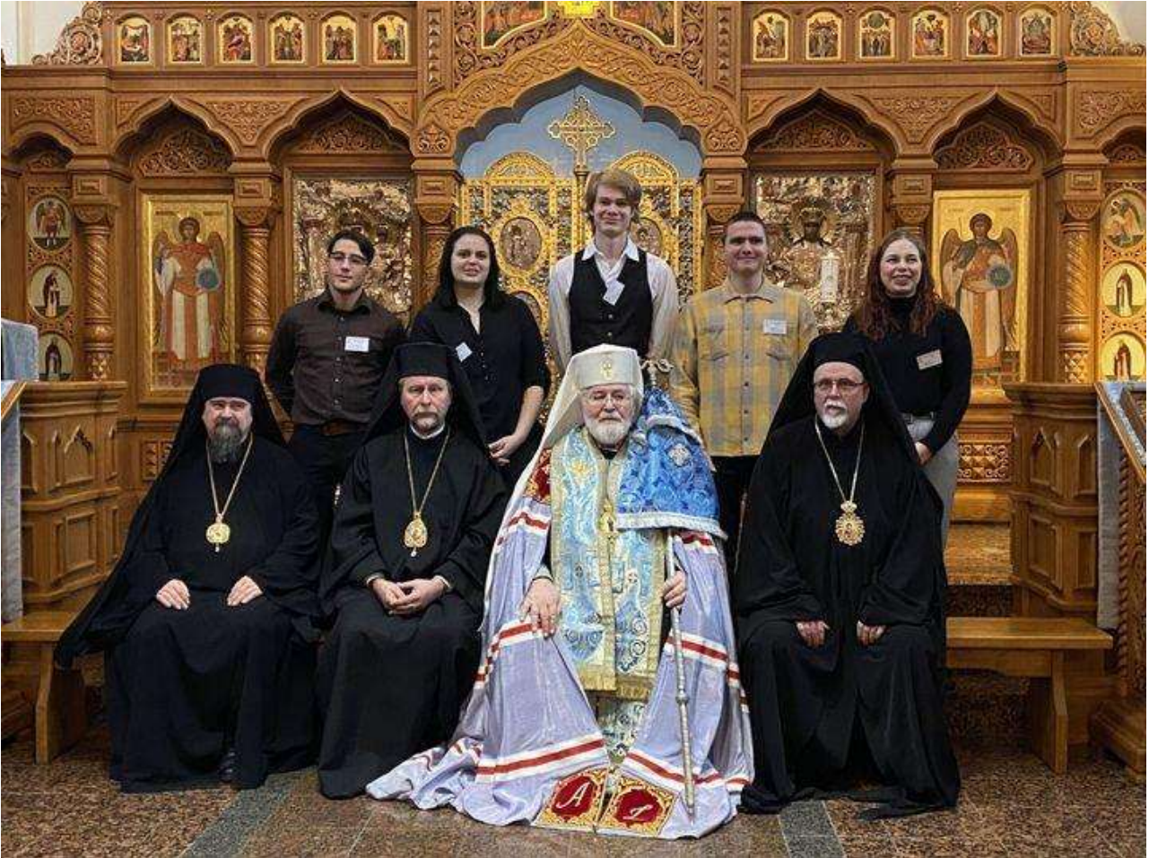
Vuoden 2022 kirkolliskokouksen stuertit Suomen ortodoksisen kirkon piispojen kanssa.

Kirkolliskokoukseen haetaan joka vuosi nuoria tutustumaan päätöksentekoon ja autamaan kokouksen järjestelyissä. Avustavia nuoria kutsutaan stuerteiksi. Tehtävään haetaan vuosittain 15–24-vuotiaita nuoria.