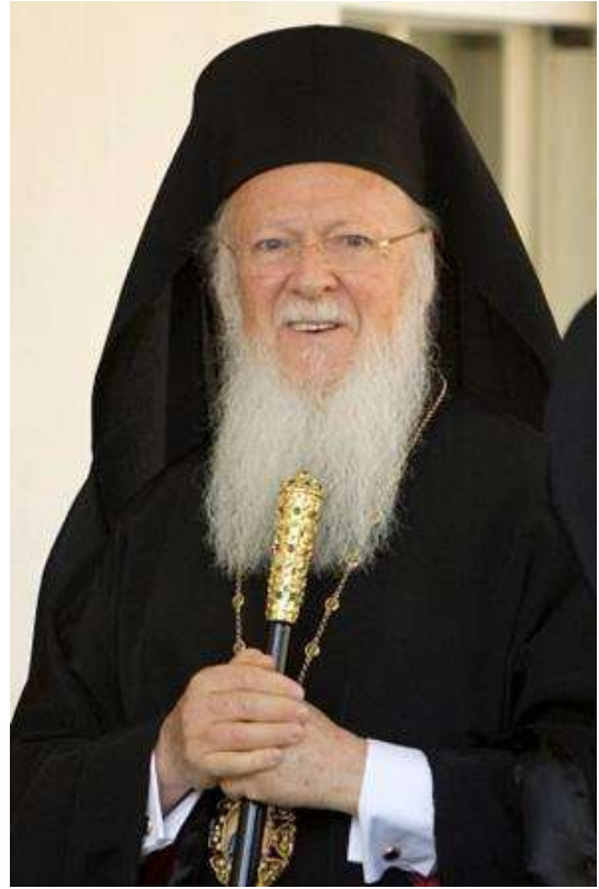
Hänen Pyhyytensä Ekumeeninen Patriarkka Bartolomeos