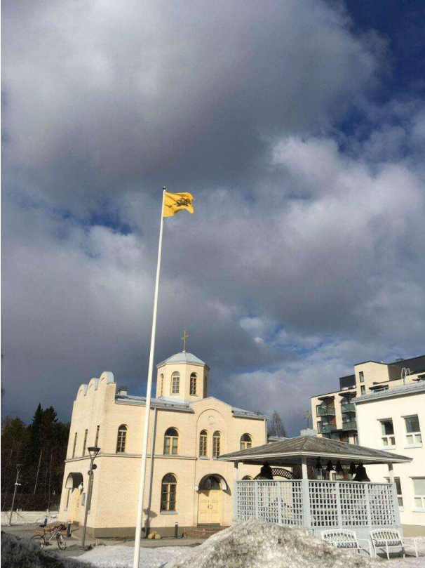
Bysantin lippu Seminaarin lipputangossa