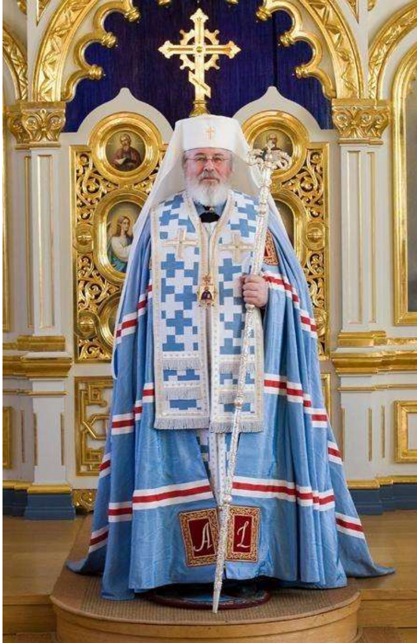
KP arkkipiispa Leo

KP Arkkipiispa Leo on toiminut piispana yli 40 vuotta. Hänet vihittiin piispaksi vuonna 1979, oltuaan viisi vuotta pappina. Hän oli ensin apulaispiispa, sitten hän toimi Oulun metropoliittana ja vielä Helsingin metropoliittana. Hänet on asetettu arkkipiispan tehtävään vuonna 2001.