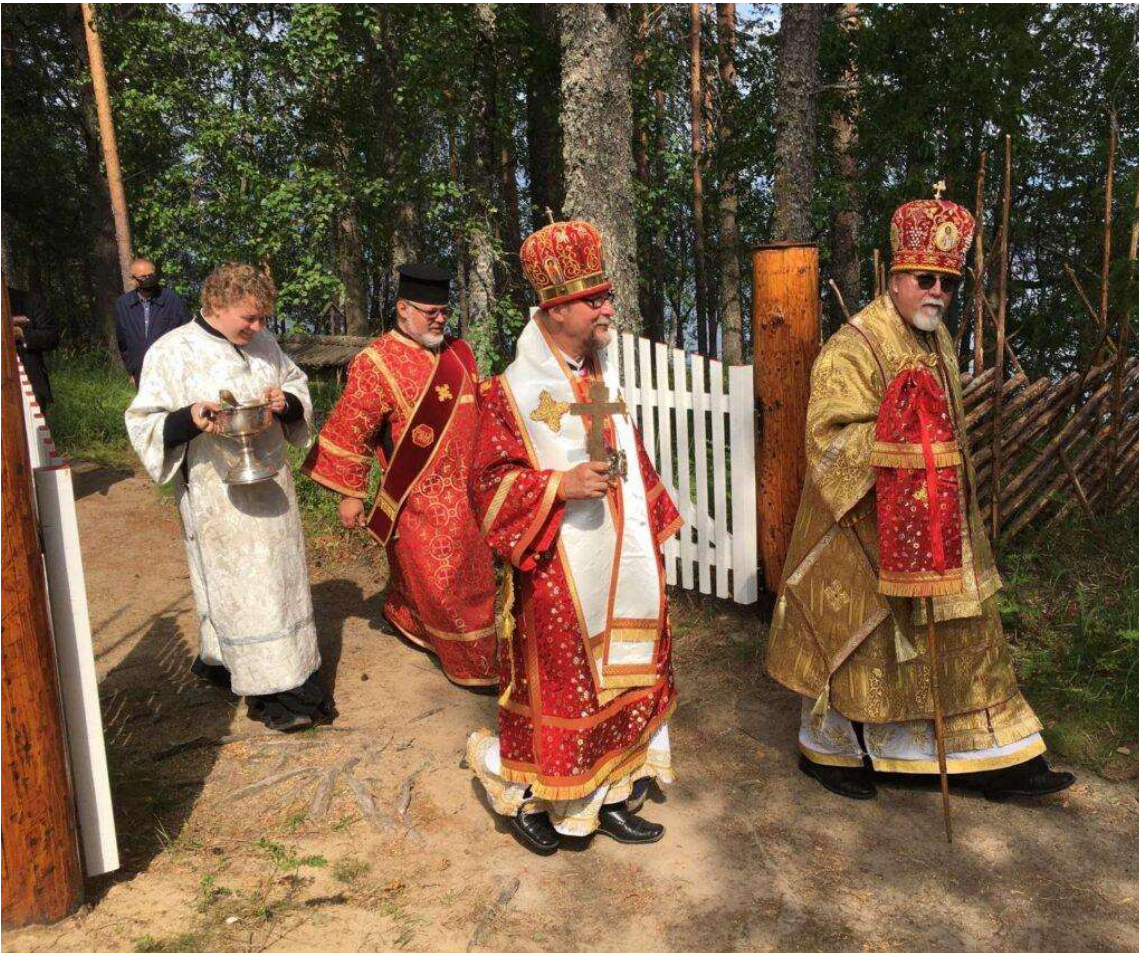
KP Kuopion ja Karjalan metropoliitta Arseni ja KP Oulun metropoliitta Elia

Ekumeenisessa ortodoksisessa kirkossa Suomen ortodoksisen kirkon hiippakunnat ovat kirkolliselta asemaltaan metropoliittakuntia.