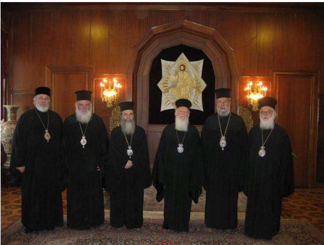
Patriarkaatisa, kuva Arkkipiispan kuvagalleria