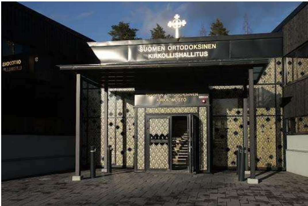
Kirkollishallituksen pääsisäänkäynti Kuopiossa.

Kirkollishallitus kokoontuu tarvittaessa. Usein asioita on sen verran, että on tarve kokoontua noin kerran kuukaudessa.