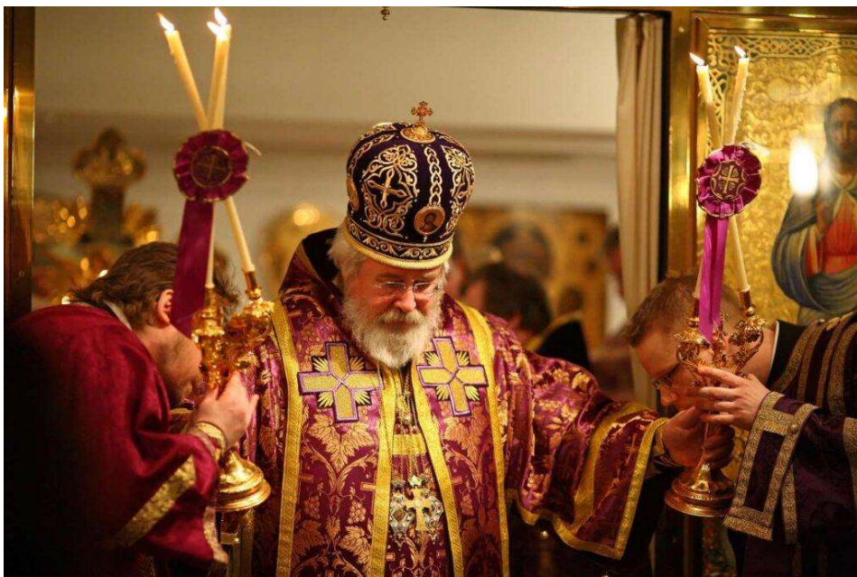
KP Helsingin ja koko Suomen Arkkipiispa Leo

Vuodesta 2022 arkkipiispan rinnalla ja apuna toimii apulaispiispa. Hänen nimensä on Haminan piispa ja asemapaikkansa Helsinki. Apulaispiispan tehtävänä on piispainkokouksen päätöksen mukaan: arkkipiispan avustaminen tämän ohjauksen mukaan, kirkon julkaisutyö, sisälähetystyö, monikulttuurinen työ, nuorisotyö sekä koulutus.