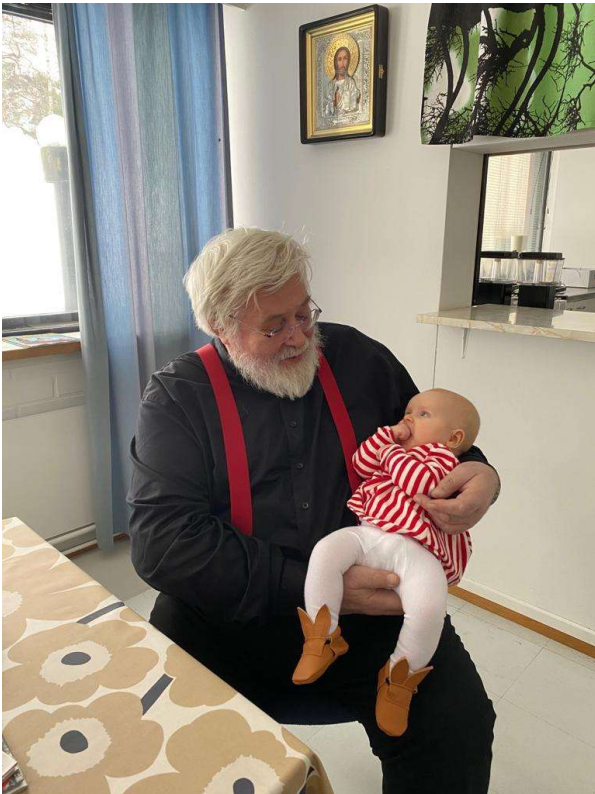
Kirkon keskustalossa