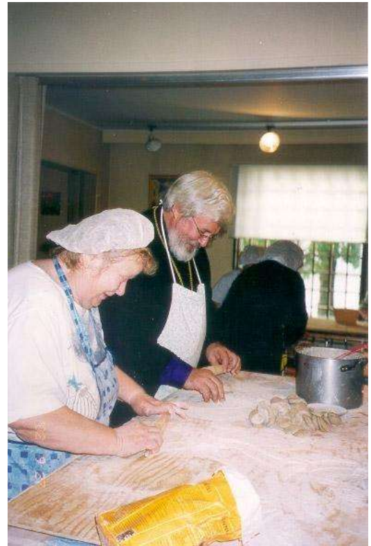
Piirakkataloissa, kuva Arkkipiispan kuvagalleria