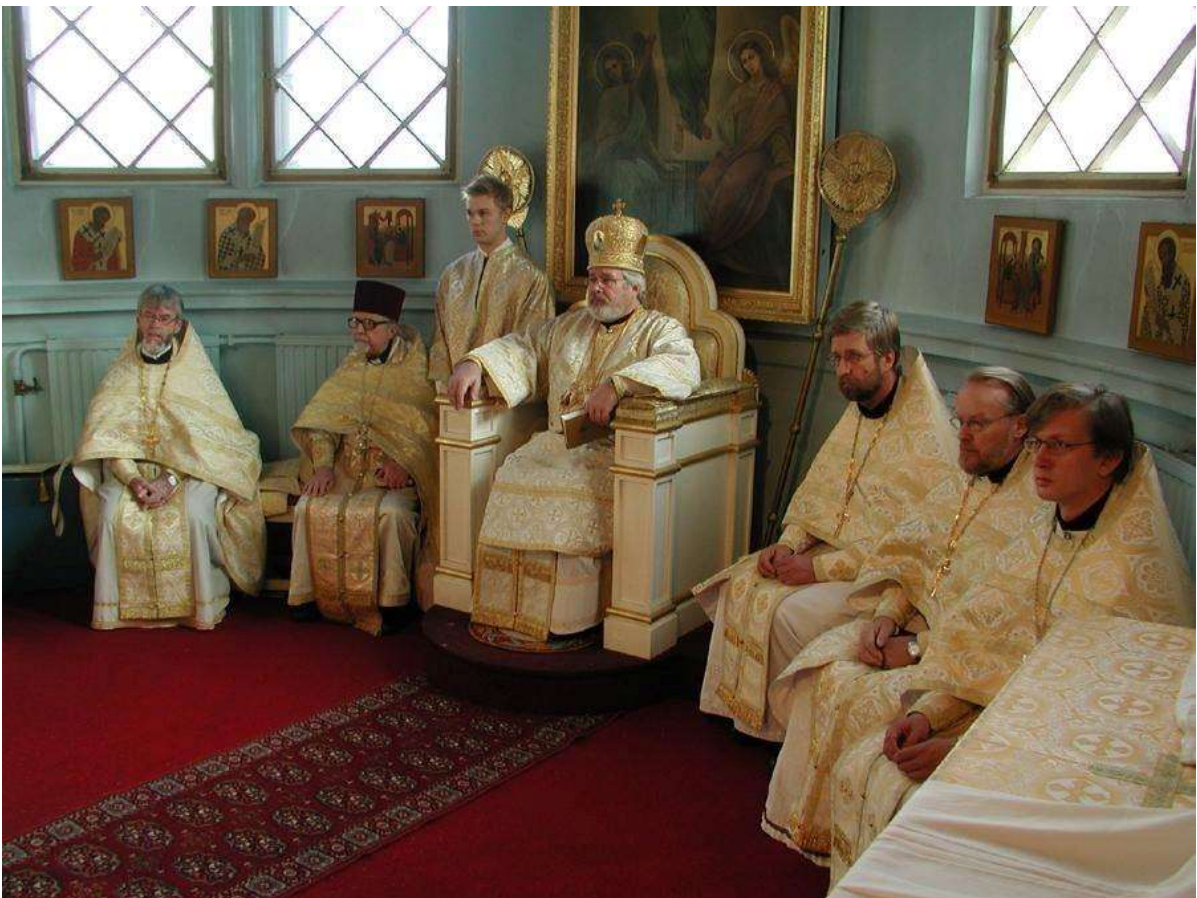
Kuopion katedraalissa