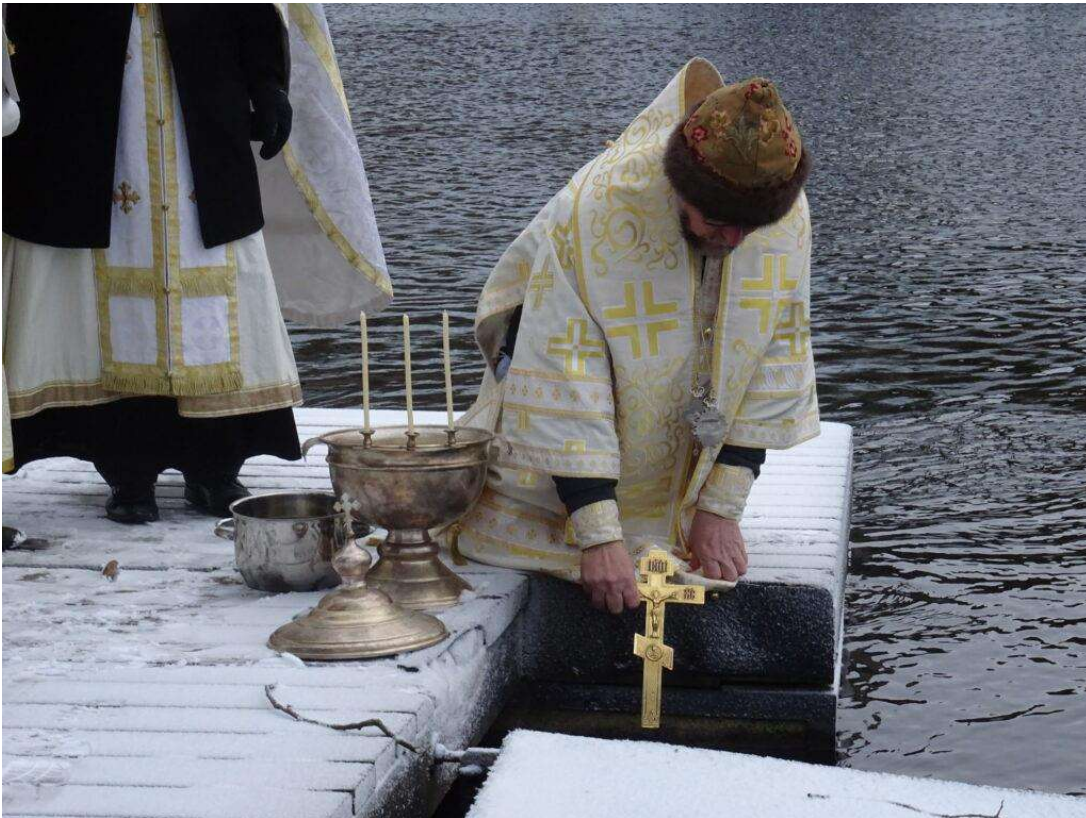
Vedenpyhitys Savonlinnassa 2020