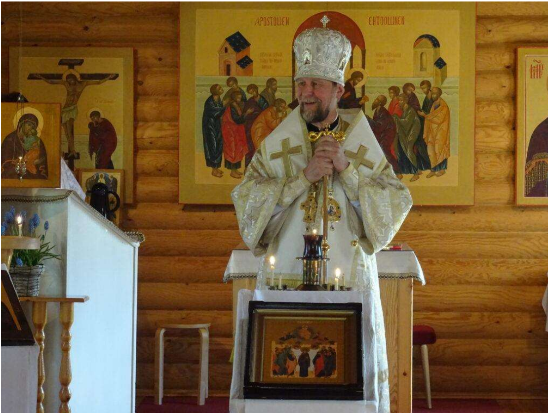
Jyväskylän seurakunnantarkastus