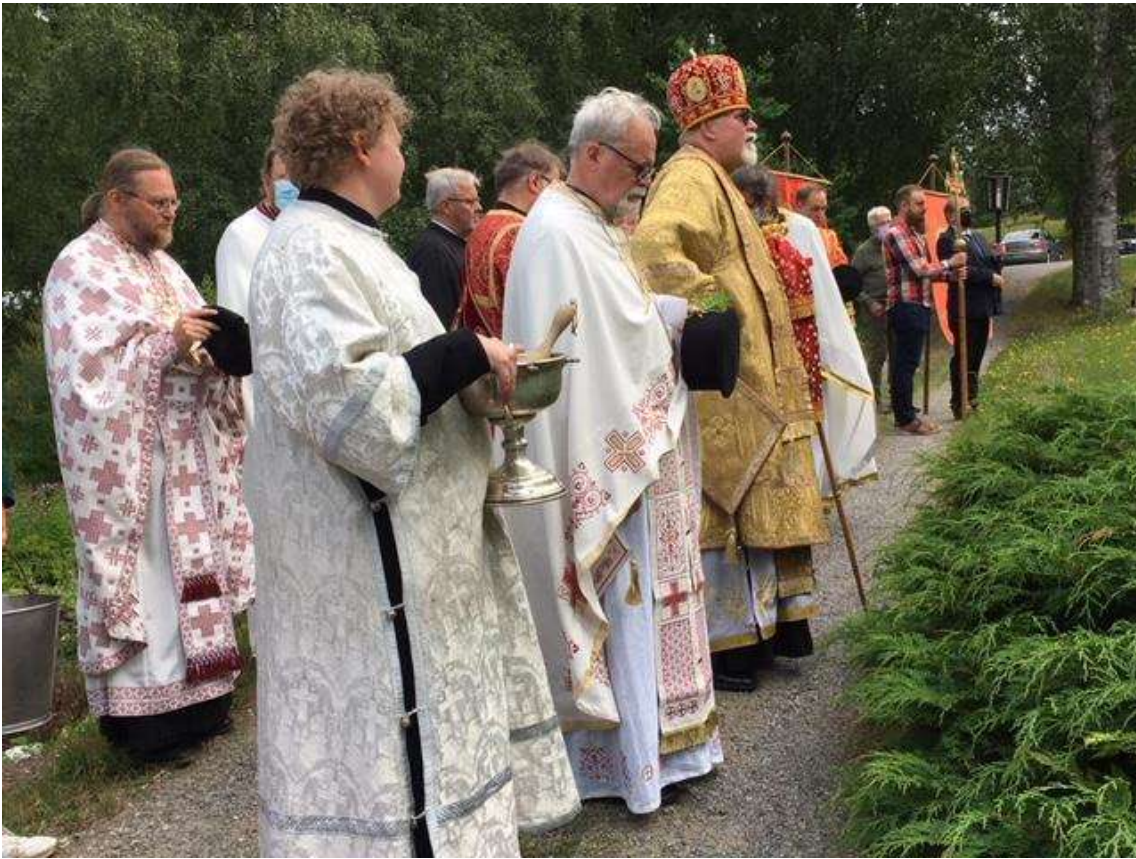
Iljan praasniekassa