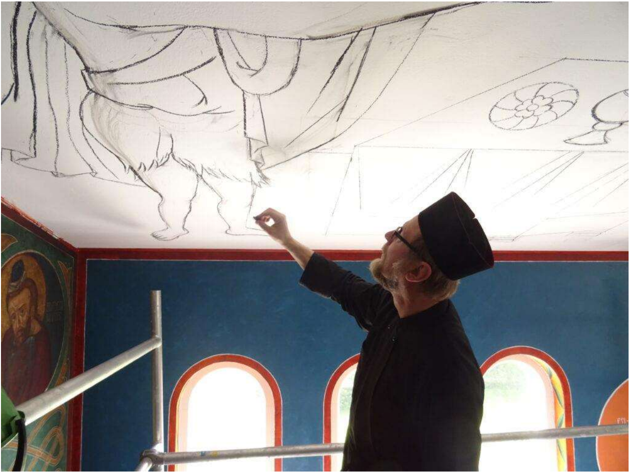
Kattofreskon hahmottelua