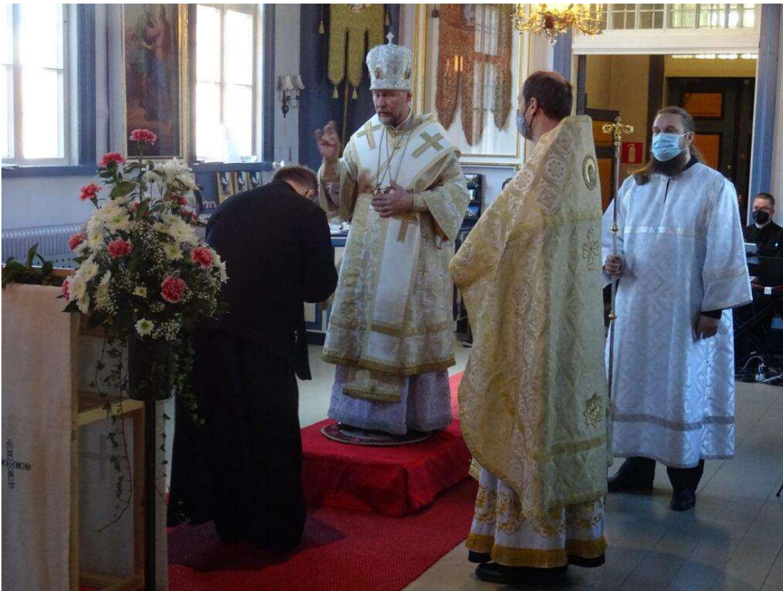
Kirkkolaulupäivillä 2021