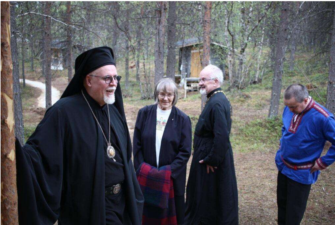
Lapissa, kuva Artturi Hirvonen